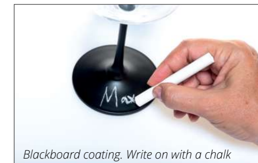
Blackboard coating. Write on with a chalk

8327.2 Set 6 Calice vino rosso Set 6 red wine glass Ø cm. 8,9 - h cm. 23 - cl. 58 Ø inch. 3,5 - h cm. 9 - oz 19,6